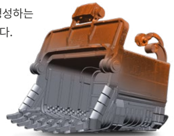
Geomagic Design X에서 생성한 파라메트릭 솔리드 모델

CAD 사용자라면 Geomagic Design X도 바로 사용할 수 있습니다. 사용자 인터페이스와 워크플로 도구를 완전히 새롭게 개선하여 3D CAD 및 모델 데이터를 최종 설계와 빌드에 따라 신속하고 정확하게 생성하는 작업이 이전보다 훨씬 쉬워졌습니다.